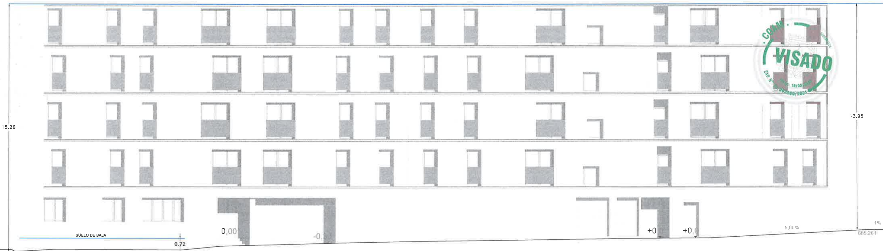
ALZADO CALLE VELARDE